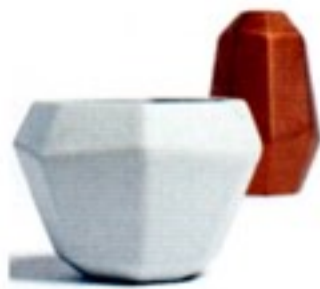
Labyrinth, candelabro in pyrex, prototipo. Flint, vasi per Memento