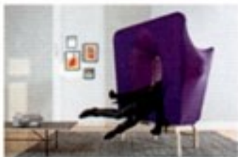
All-a-round, collana in plexiglas tagliato al laser. Our, poltrona prototipo in lycra e acciaio