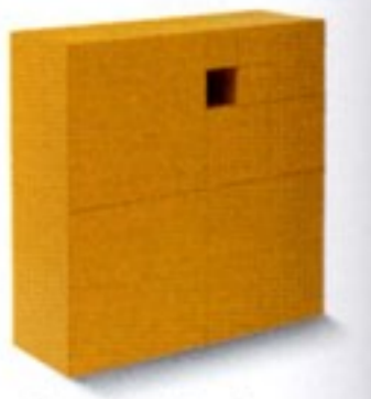
Ala, séparé in giunco per V. Bonacina. Madia laccata Conchiglia Lema