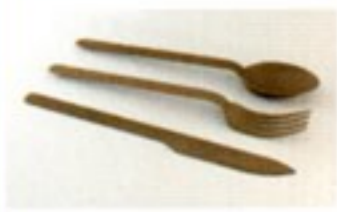
Stratos, sedia in faggio, per Danese. Orissa, set di bio-posate per Vipot