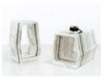
Di marmo: Swing, luci a led; Strati, tavolini per Sartore Marmi