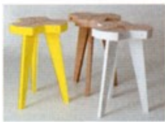
Jachin, luce per Bosa Ceramiche. Offset stool in multistrato per Maison203